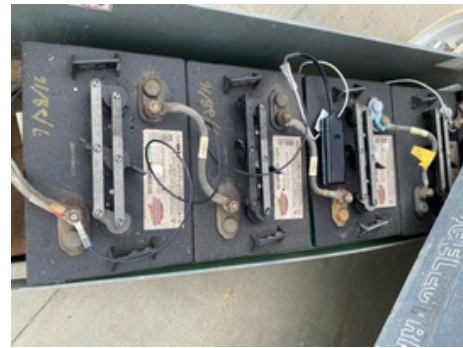
Exemple: Source d'alimentation située sur un pont élévateur à ciseaux.

2. Identifiez chaque fil sur votre appareil EZTrac HE.