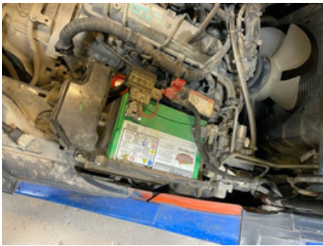
Exemple: Source d'alimentation située sur un chariot élévateur.

1. Identifier les fils d'alimentation, de masse et d'allumage sur le faisceau de câbles.